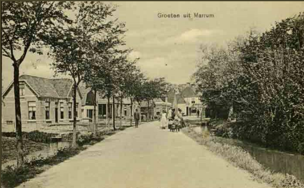
Lage Herenweg ca. 1910. Rechts de gracht bij het Heephûs. Deze gracht werd in de winter vaak gebruikt om op te schaatsen.

Dat de 19e eeuw een saaiere periode is geweest, kun je niet zeggen. Overal kwam er vernieuwing tot stand op velerlei gebied. Uitvindingen werden gedaan, zoals stoommachines, treinen, dorsmachines, fotografie en wat al niet meer. Op agrarisch gebied kwam er ook vooruitgang, al was het vaak met moeite, veel zat er op de centen vast. Maar geleidelijk werden er grotere stallingen voor het vee gebouwd en grotere schuren om het hooi, graan, stro en peulvruchten in op te bergen. De teelt van aardappelen, vlas, suikerbieten en cichorei werd steeds meer van belang. Veel boerderijen van nu zijn nog bekend onder de naam van hun oorspronkelijke bewoners.