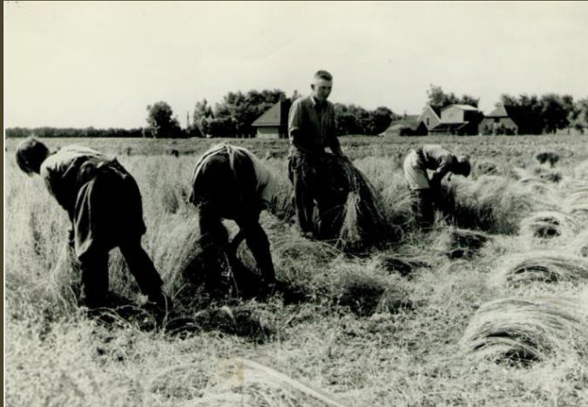
In de buurt van Westernijtsjerk wordt het vlas getrokken, ca. 1935

Bestuursorganen werden verbeterd of opgericht. Historisch besef kwam meer en meer te voorschijn. Bouwkunde, nijverheid en handel gingen hand in hand. Maar op het platteland kwam slechts langzaam enige mechanisatie tot stand. In de 19e eeuw werd het gras nog hoofdzakelijk met de zeis gemaaid, de aardappelen (op ekers) met de greep gerooid, het vlas op de bank gereseld en het hooi met de vork los op de wagen getast. Dit alles vergde veel mankracht. Dat er in de zomer op een flinke boerderij zomaar tien arbeiders en acht paarden hun werk vonden, was vrij normaal.