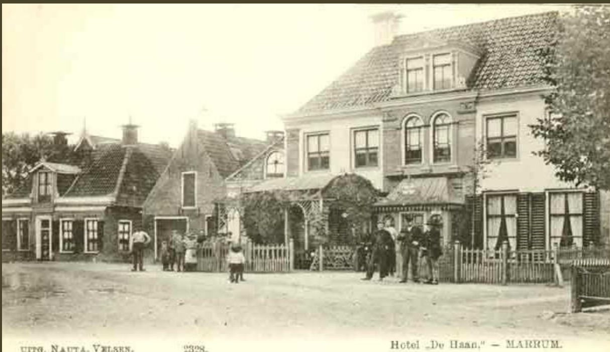
Hotel De Haan, later De Groene Oase genoemd, ca. 1900. Het gebouw links van het hotel was een cichoreidrogerij

Dat de 19e eeuw een saaiere periode is geweest, kun je niet zeggen. Overal kwam er vernieuwing tot stand op velerlei gebied. Uitvindingen werden gedaan, zoals stoommachines, treinen, dorsmachines, fotografie en wat al niet meer. Op agrarisch gebied kwam er ook vooruitgang, al was het vaak met moeite, veel zat er op de centen vast. Maar geleidelijk werden er grotere stallingen voor het vee gebouwd en grotere schuren om het hooi, graan, stro en peulvruchten in op te bergen. De teelt van aardappelen, vlas, suikerbieten en cichorei werd steeds meer van belang. Veel boerderijen van nu zijn nog bekend onder de naam van hun oorspronkelijke bewoners.