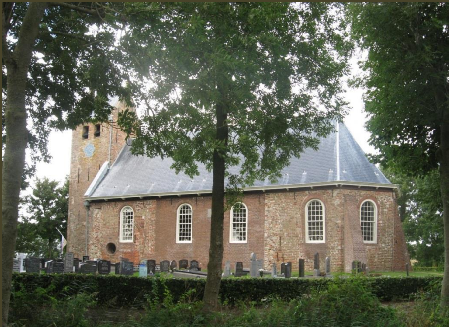
Aan de muren van de kerk van Westernijtsjerk is te zien dat deze uit verschillende perioden stammen

De Hervormde kerken van Marrum en Westernijkerk zijn door de jaren heen vaak veranderd, aangepast of verbouwd, waarbij geleidelijk het oorspronkelijke is verdwenen. Zo had "Marrum" in 1703 nog een (stompe) zadeldak-toren en een aantal fraaie steunberen. Sommige ramen zijn dichtgemetseld of verplaatst, evenals de in- en uitgangen. Daardoor is er veel van het karakteristieke verloren gegaan.