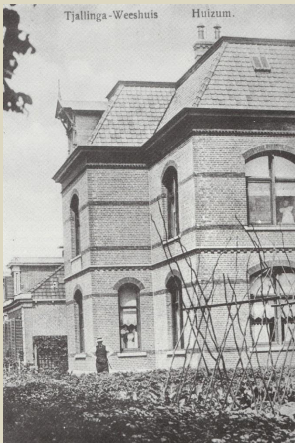
Het Tjallinga Weeshuis in Huizum in 1909. Op de plek van het oude weeshuis was in 1907 een nieuw onderkomen gebouwd. (Uit: Vier eeuwen Tjallinga Weeshuis van J. F. Broos)

Het weeshuis in Huizum zou tot 1938 in functie zijn. Daarna ondersteunde de stichting op een andere manier (half)wezen, wat zich later ontwikkelde tot de huidige praktijk dat de stichting Tjallinga Weeshuis projecten steunt die tot doel hebben het leven te verbeteren van jongeren die het maatschappelijk en/of economisch moeilijk hebben. Dit wordt gefinancierd met de inkomsten uit de verpachte boerderij Tjallinga State, verpachte landerijen bij Wytgaard (in de periode 1895-1930 aangekocht door de stichting) en effecten. En zo wordt in een tijd met geheel andere behoeften en noden dan 475 jaar geleden nog steeds gehandeld in de geest van de stichtster Kinsck van Ropta.