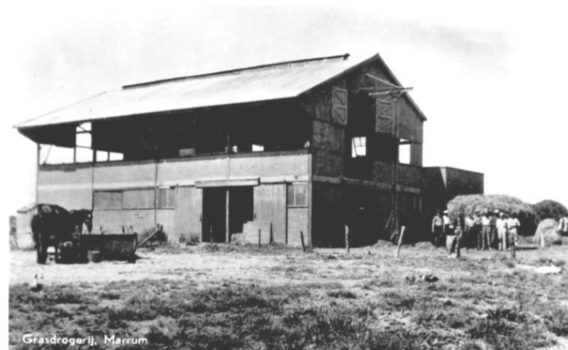
Grasdrogerij Marrum De grasdrogerij omstreeks 1945