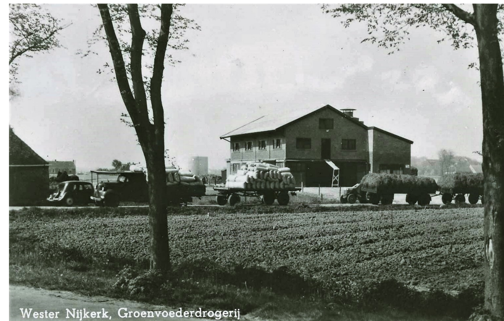
Wester Nijkerk, Groenvoederdrogerij Aanvoer en afvoer op de Stasjonwei voor het gebouw van de grasdrogerij

In het droogseizoen werkten enkele tientallen mensen bij de drogerij, van wie een aantal bezig was met de aanvoer van het gras.